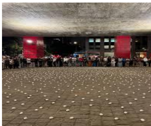
FIGURA 1 - Em uma parte do vão do MASP, a demarcação retangular para a performance Ka ter lugar.