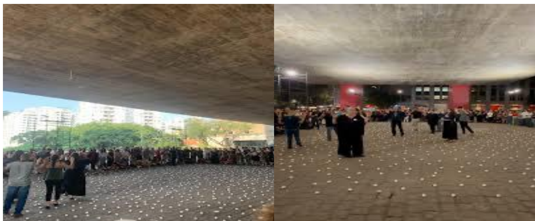
FIGURAS 6 e 7 - A movimentação dos performes no espaço da Performance Ka .

cuidadosamente no centro do paralelepípedo de muitos paralelepípedos. Pela ação das pessoas performantes no ato de passagem da ação a outros que aí estão acompanhando, ocorre a formação de um coletivo que se constituiu diante deles em um fazer que se repete umas vinte vezes até que homens, mais ou menos jovens, e mulheres, mais ou menos jovens, componham o grupo que se reúne num círculo em que os participantes se abraçam e começam juntos a entoar nessa aproximação uma sonoridade que repetem como sons ritualísticos com a finalidade de conduzir a uma mudança de estado de ânimo e de alma. Com a postura equilibrada e olhar participante, Maiolino que permaneceu postada no centro da margem tudo regendo, ela também está emitindo a sonoridade que integra todos em um coro de conexões.