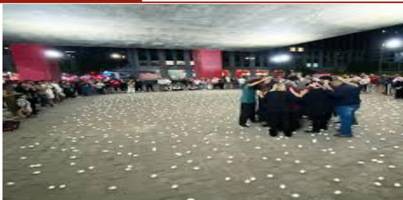
FIGURA 8 - A movimentação dos performes no espaço da Performance Ka .

As vozes entoando o canto em grupo se voltam para o entorno quando a performer Maiolino profere as seguintes palavras de ordem: “ não!! não!! ”, “ basta ”, “ chega de violência ”, “ chega de mortes ”, “ basta as armas ”, “ basta as guerras ”, “ chega de balas perdidas ”. E cada participante profere a sua palavra de ordem e, logo, os presentes no entorno proferem também as suas palavras que as proclamam em voz baixa e, depois, em voz mais alta para serem ouvidos, ao mesmo tempo em que escutam os clamores dos demais presentes.